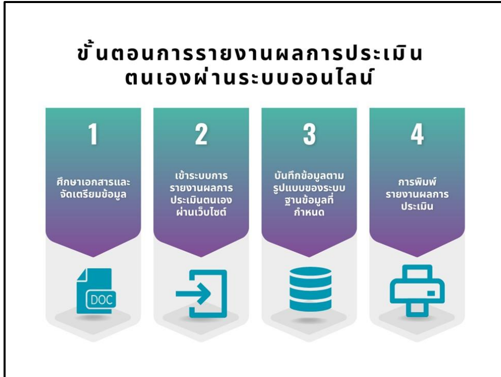
ภาพที่ 7.1 การรายงานผลการประเมินตนเองผ่านระบบออนไลน์